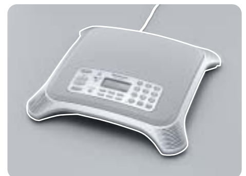
Sistema per conferenze IP KX-NT700

Sia NCP500X che NCP500V sono dotati di serie di staffe per il montaggio a parete.