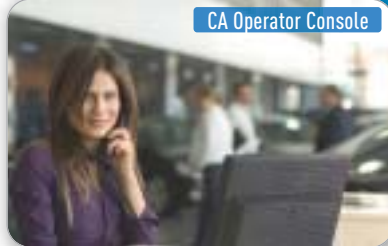
CA Operator Console

CENTRALINISTA CHE GESTISCE LE CHIAMATE DEI CLIENTI