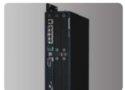
Staffa per montaggio a parete KX-NCP500X/V