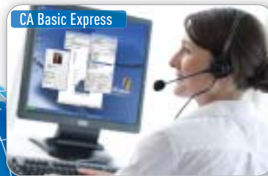
CA Basic Express

OPERATORE REMOTO CHE UTILIZZA IP SOFTPHONE